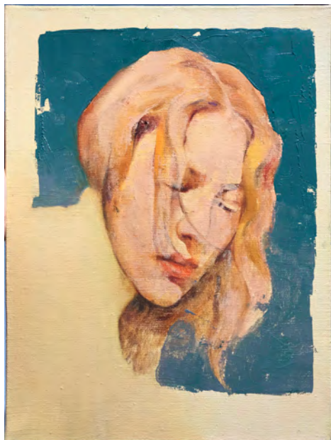
Sans titre, 2020 - Huile sur toile - 40 x 30 cm