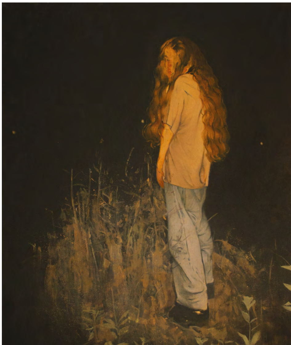
Surpris, 2019 - Huile sur toile - 163 x 140