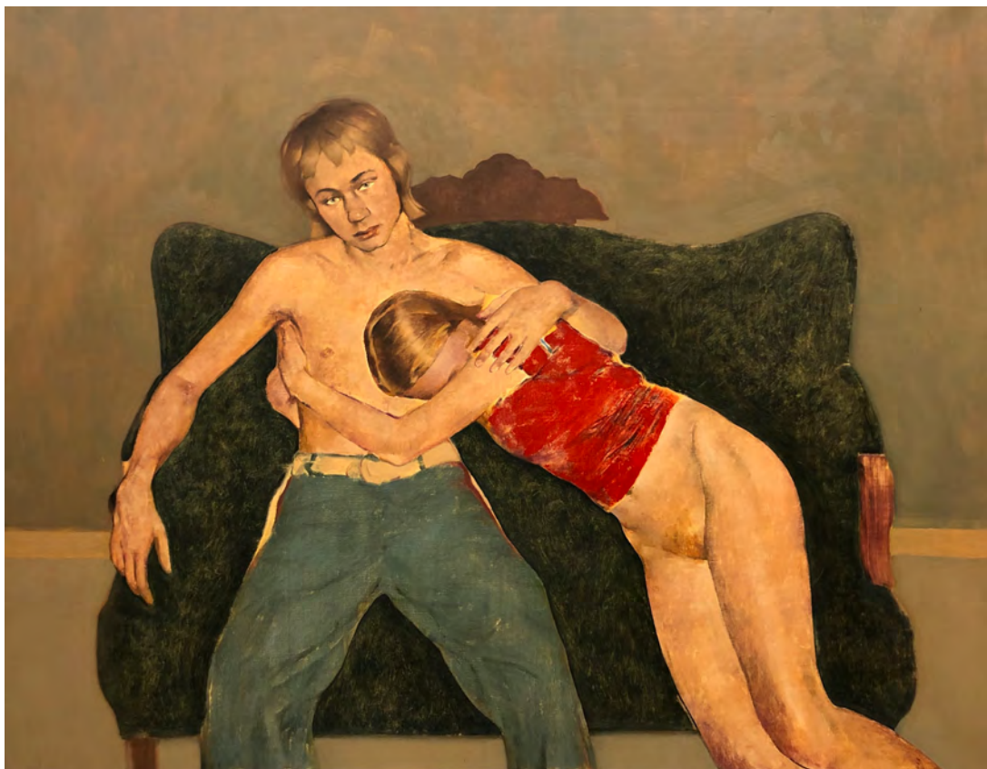
Divan, 2020 - Huile sur toile - 140 x 163 cm