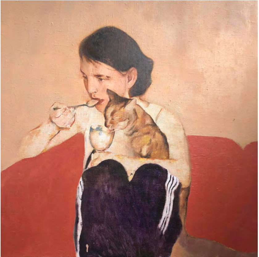
Ice Cream, 2019 - Huile sur toile - 80 x 80 cm